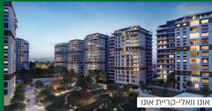
אונו וואלי-קריית אונו