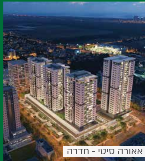
אאורה סיטי - חדרה