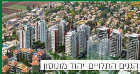
הגנים התלויים-יהוד מונסון