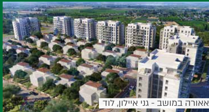
אאורה במושב - גני איילון, לוד