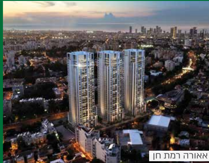
אאורה רמת חן